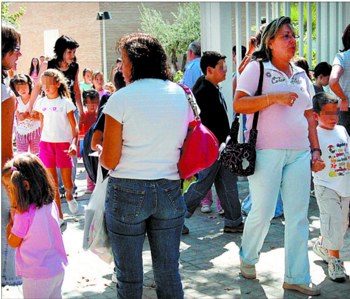
Salida de un colegio de Valencia en un primer día de curso.

La llegada masiva de alumnado extranjero llegó en un momento en el que el sistema educativo