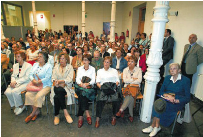
Alumnos de entre 55 y 82 años, en un comienzo de curso de las Aulas de la Experiencia de la UPV.

Desde el curso 2011-2012, se dará prioridad a las optativas que estén vinculadas a ámbitos de la enseñanza reglada —el graduado escolar— y a la no reglada que tenga como objetivo el acceso a la universidad, la FP y el empleo. También resultará prioritaria la enseñanza del español